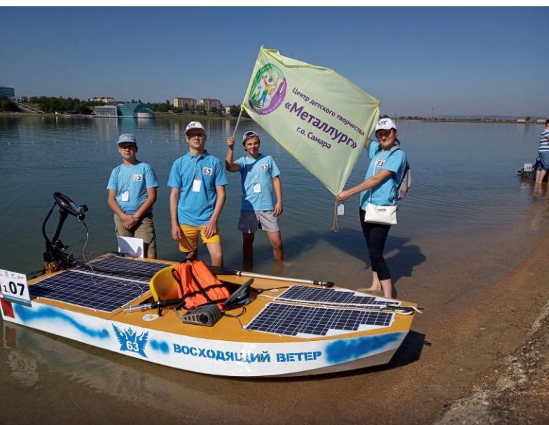
Участники всероссийских инженерных соревнований «Солнечная регата» (г. Грозный 2018 г.) Проект «Юный техник»

Сохраняя традиции, она намерена вести «Металлург» к успеху. Завод (на тот момент он назывался «Самарский металлургический завод») вновь осознает, что качество жизни – это важный показатель труда, а значит надо оказывать поддержку маленьким жителям городка Metallurgov. И вот в 2011 году Центр получает первый грант от СМЗ. Начинается ремонт, появляется новая техника. Начинается эпоха модернизации. Новое время, новый темп, новый образ детства. С этого времени завод вновь активно помогает Центру, реализуются общие проекты, сотрудники заводууправления становятся членами жюри в наиболее ярких технических конкурсах – присматривают юных техногениев.