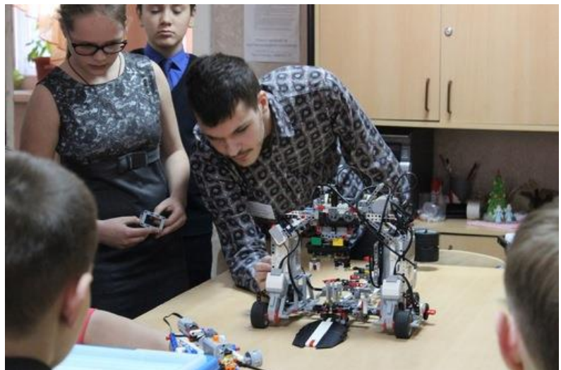
Занятие по робототехнике

А ведь великолепные праздники – это еще одна удивительная традиция ЦДТ. Потрясающий Новый год, Масленица, Творческие отчеты – это масштабные и яркие карнавалы, захватывающие не только воспитанников Центра, но и его выпускников и даже жителей всего городка Metallurgov. Но в Центре есть еще и камерные праздники; День Кота, Праздник яблочного пирога – это теплые, домашние затеи, которые не только радуют участников, но и формируют в детях желание помогать близким – ведь это благотворительные акции в помощь тем, кто очень этой помощи ждет.