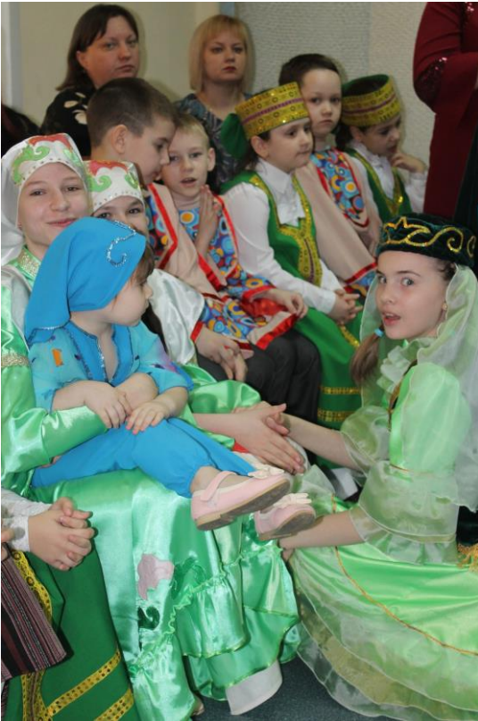
Фестиваль «Венок дружбы» (2019 г.) Проект «Мы – россияне»

В 2020 году в Центре детского творчества «Металлург» обучается более пяти тысяч детей. И работает более ста педагогов. Это крупнейшая организация дополнительного образования нашего города, ведь у Центра широчайшая сеть клубов по месту жительства – сейчас их насчитывается двадцать четыре. Это настоящая фабрика трансляции самых разных умений и навыков. Творческие коллективы Центра занимают призовые места на самых престижных всероссийских и международных конкурсах и фестивалях. На сегодняшний день в ЦДТ «Металлург» работают два образцовых коллектива – театральный коллектив «Школа звезд» и ансамбль «Смайл», и мы ждем подтверждения высокого статуса третьего – театра моды «Злата».